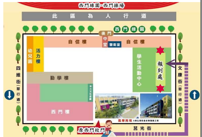
西門國小周邊停車場位置示意圖